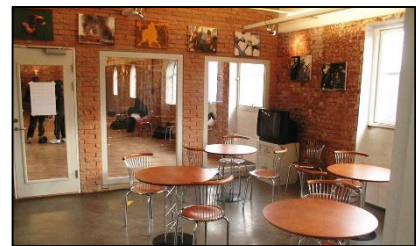
Café til 3. halvleg

Lokalet finder du i Spinderihallerne, Spinderigade 11 F